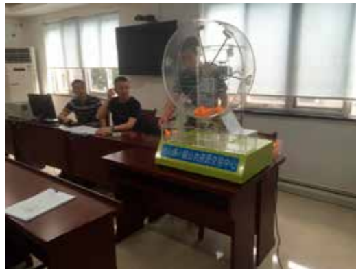
图为径山镇小额公共资源交易中心项目招投标现场

为打造多维度的监督体系，余杭区纪委监委积极引入“村级+村民”民主监督模式，让老百