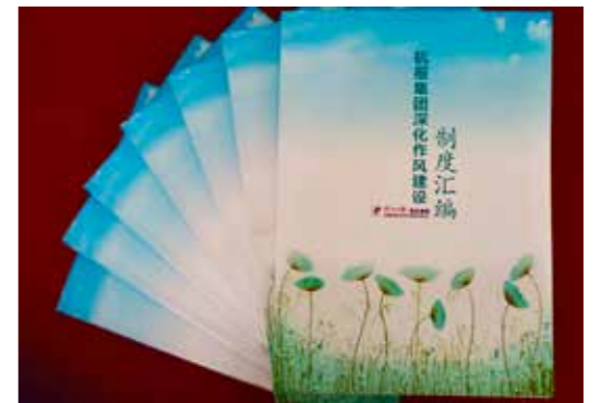
图为杭报集团纪委梳理编印的作风制度汇编

通过编印《作风制度汇编》，组织学习《处分条例》和《监察法》，组织观看“警钟长鸣”