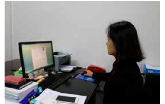
图为临岐镇纪委工作人员在查看清廉档案

为真正让这些基层监察组织更好地发挥作用，县纪委监委第一时间组织乡镇派出监察办公室对乡镇所有监察对象进行全面的调查摸底，并根据调查摸底情况建立监察对象清廉档案。清廉档案除了包含个人基本信息，还对监察对象的考核测评、工作开展、群众评价等情况进行记录，并针对监察对象的岗位特点排查廉政风险。与此同时，县纪委监委建立清廉档案库，实行电子化动态管