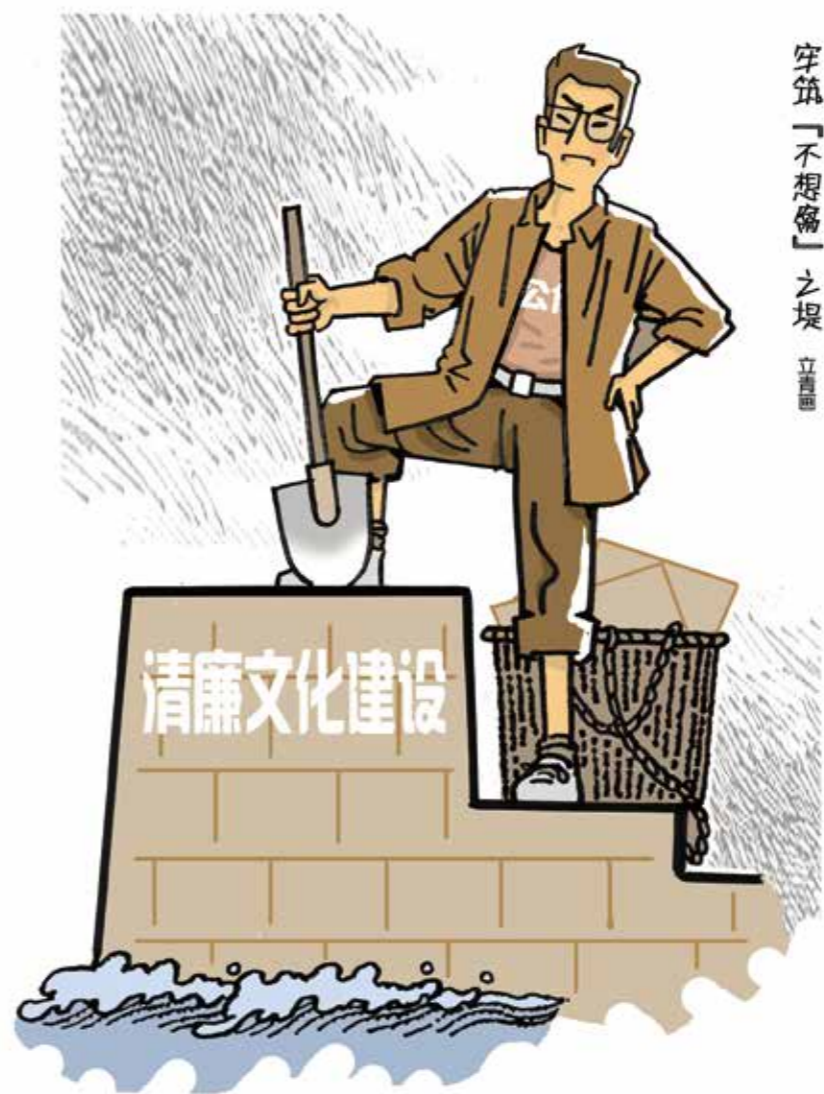
穿筑「不想腐」之堤 立善德

挖掘提炼“红色文化”中蕴涵的廉洁元素，精心打造革命传统教育和廉洁文化教育同台传播的大平台，是杭州注重廉洁教育、增进廉洁意识、涵养管党治党文化基础的又一重要抓手。杭州先后推出了淳安茶山会议原址、萧山红色衙前展览馆、梅家坞周恩来纪念室、外桐坞朱德纪念室等红色文化教育基地，大