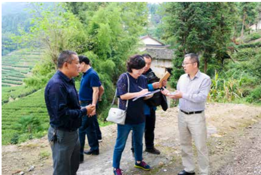
江干区纪委监委在湖北省恩施市开展东西部扶贫协作工作专项督查期间，深入田间地头，与当地群众深入交谈，详细了解扶贫项目建设给群众脱贫带来的实际效果。