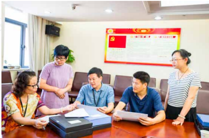
西湖区纪委专项督查组在区民政局对全区扶贫领域补助款发放情况开展监督检查。