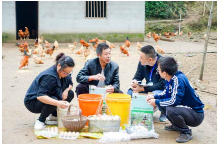
富阳区渚镇纪委紧紧围绕确保脱贫攻坚工作有效落实，抓住扶贫领域易发多发的优亲厚友、虚报冒领、截留资金等问题，开展基层巡察，深入乡村家禽养殖点核实有关涉农补助资金落实情况。