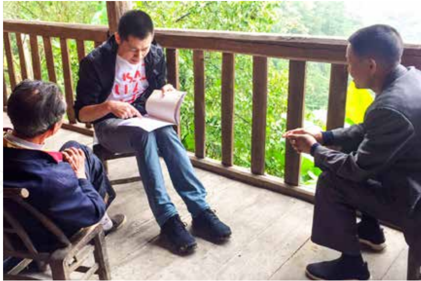
上城区纪委监委选派青年干部前往湖北省恩施州鹤峰县纪委监委挂职锻炼，全程参与该县扶贫领域监督执纪，确保事事有纪、件件有效、人人有责。图为上城区纪检干部在鹤峰县少数民族山区村寨走访村民，调查有关案件问题线索。