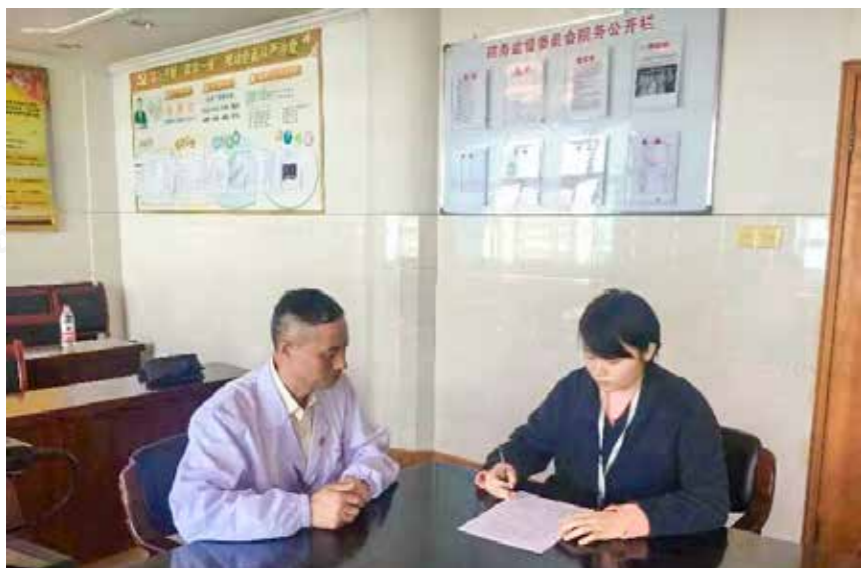
乾潭镇卫生院与医生签订廉洁承诺书

建德市还组建成立卫生计生局会计核算中心，实行会计集中办公、集中管理，从而真正做到按制度独立规范核算、全程监管，以制度约束规范收支管理，从源头上防范廉政风险。同时出台《建德市卫计系统基建项目管理办法》，针对历年来系统内50万元以下的零星项目招投标不规范问题，主动与发改、财政、审管办进行对接，今年已将系统内总计180万元的28个零星项目进行打包，统一在市交易中心进行招投标，进一步加强医疗单位基建项目和设备采购的监督管理，夯实廉政监管基础。