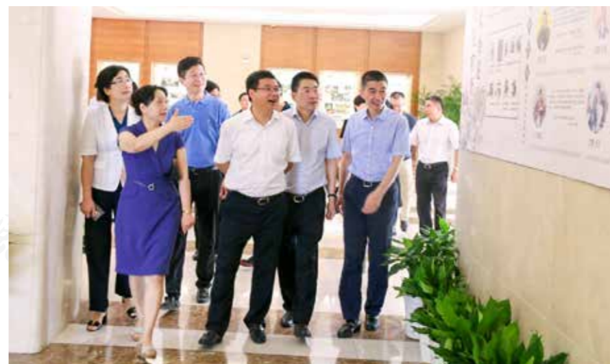
省纪委副书记、监委副主任暨军民，市委常委、市纪委书记、监委主任陈擎苍领导一行赴上城区调研清廉学校建设工作。

出台专门文件，划分责任范围，明确阶段任务。区纪检监察机关和教育行政部门扎实开展党风廉政建设明察暗访和专项检查，严格落实监督执纪“四种形态”，抓早抓小，防微杜渐，广泛开展警示教育，强化清廉意识形成自觉。各校成立清廉学校建设领导小组，首先明确书记、校长的责任，形成“一把手