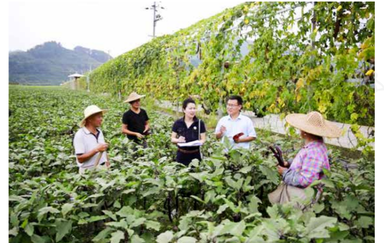
临安区纪委检查人员来到於潜镇光明村核查扶贫领域农业资金发放使用情况。