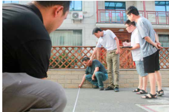
建德市杨村桥镇纪委针对扶贫领域工程进行专项督查，图为该镇纪委干部在上山村监察联络员的配合下，对村级扶贫道路工程进行现场测量。