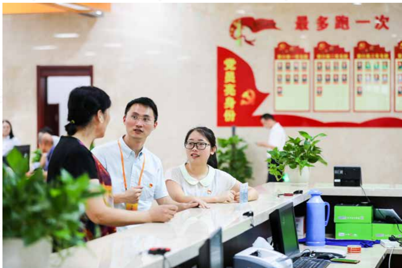
近期，淳安县对“最多跑一次”改革进行专项巡察。图为巡察组工作人员向办事群众了解情况。毛勇锋 摄