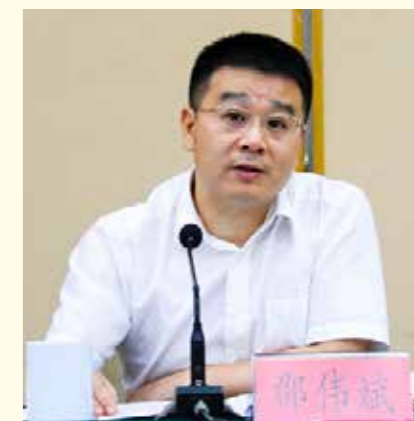
工作，形成具有余杭特色的清廉乡村模式，以点带面夯实清廉余杭建设的基层基础。

四是要在推动实现“社会清朗”上持续发力，如要加强非公企业纪检工作，实现组织全覆盖、监督无盲区；要办好中国（浙江）廉政故事大奖赛，进一步提升廉政文化的传播面和感染力；要用好民主监督公开日、村务监督微信群等公开载体，加强和规范村（居）务监督